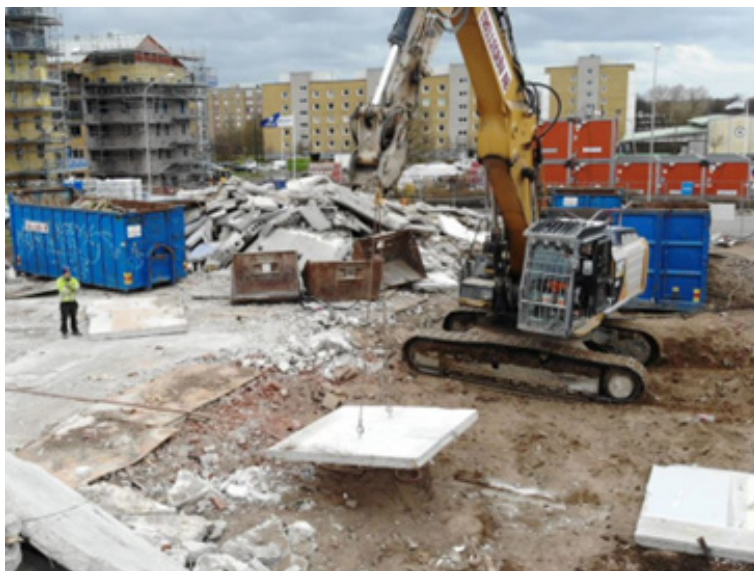
Foto: betonelement på Drottninghög

Eksempelvis er der opført et udstillingsbyggeri i Drottninghög i Helsingborg med genbrugte betonelementer.