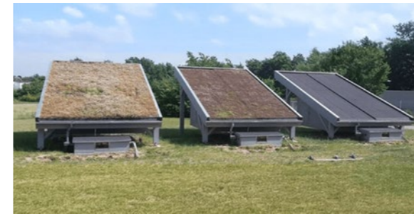
Billedet er AI-genereret

Rockflow-elementer er baseret på stenuld, tilbageholder og forsinke regnvandet lokalt, inden det ledes til kloakken. Det tager cirka 5-8 dage at installere og kræver ikke gravearbejde. Sensorer bruges til at monitorere effekten af anlægget og hvornår anlægget skal renses.